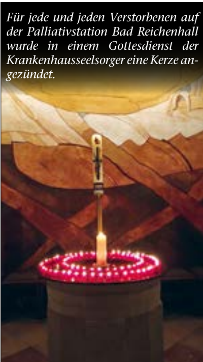
Für jede und jeden Verstorbenen auf der Palliativstation Bad Reichenhall wurde in einem Gottesdienst der Krankenhauseelsorger eine Kerze angezündet.

In der Kirche kamen an St. Martin Kinder und ihre Eltern zusammen. Sie bekamen Lichttüten, um sie in ihr Fenster zu stellen und anderen eine Freude zu machen.