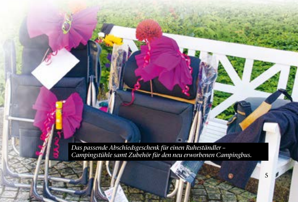
Das passende Abschiedsgeschenk für einen Ruheständler – Campingstühle samt Zubehör für den neu erworbenen Campingbus.

...in den Ruhestand am 9. August 2020 in der Evang. Stadtkirche Bad Reichenhall